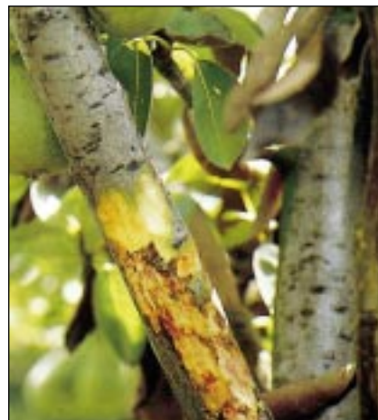
Chancre sur une branche charpentière : les tissus infectés sont humides, brillants et prennent une coloration rouge-brun

Poiriers : variétés de plus sensibles à moins sensibles :