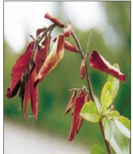
Jeune pousse infectée de Pyracantha se recourbant en forme de crosse caractéristique.

Zone 3 : zone d'apparence saine mais la bactérie est présente même si les symptômes ne sont pas encore visibles.